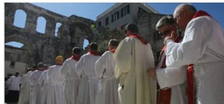
Blagdan sv. Duje, zaštitnika Splita pogledaj više