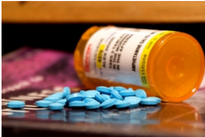
O documento do OEDT explica que a produção de anfetaminas está cada vez mais sofisticada no continente

Gerais Governo recuperou em 2011 mais de 540 milhões de euros de prestações em atraso