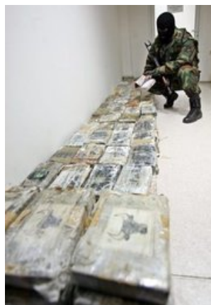
Un policier devant de la cocaïne saisie en Macédoine, à Skopje le 8 janvier 2007 /pictures/0018/4357/photo_1275234407536-1-0.jpg