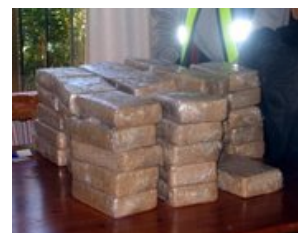
Photo distribuée par le Ministère espagnol de l'Intérieur le 15 février 2005 montrant de la cocaïne saisie sur la côte sud de l'Espagne

/pictures/0018/4361/photo_1275234549319-1-0.jpg